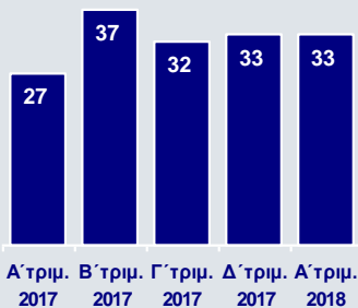
Καθαρά Κέρδη Εξωτερικού (προ εκτάκτων αποτελεσμάτων και μη συνεχιζόμενων δραστηριοτήτων, €εκ.)