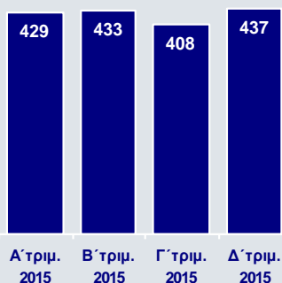
Οργανικά Έσοδα (€εκ.)

Τα οργανικά έσοδα ενισχύθηκαν κατά 7,2% έναντι του Γ' τριμήνου και διαμορφώθηκαν σε €437εκ., ενώ τα συνολικά έσοδα υποχώρησαν κατά 6,9% σε €430εκ., καθώς τα χρηματοοικονομικά και λοιπά έσοδα ήταν αρνητικά κατά €8εκ., έναντι κερδών €54εκ. το Γ' τρίμηνο.