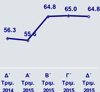
Κάλυψη Δανείων σε Καθυστέρηση (%)

Τα νέα δάνεια σε καθυστέρηση άνω των 90 ημερών στην Ελλάδα ανήλθαν σε €206εκ., το Δ΄ τρίμηνο, από €164εκ. το Γ΄ τρίμηνο, λόγω των επιχειρηματικών δανείων, ενώ τα νέα δάνεια σε καθυστέρηση για τον Όμιλο διαμορφώθηκαν σε €235εκ., από €166εκ. το Γ΄ τρίμηνο 2015. Τα δάνεια σε καθυστέρηση άνω των 90 ημερών αποτελούσαν το 35,2% του χαρτοφυλακίου χορηγήσεων στο τέλος Δεκεμβρίου 2015, από 35,0% στο τέλος Σεπτεμβρίου. Η κάλυψη των δανείων αυτών από προβλέψεις παρέμεινε σε υψηλά επίπεδα και διαμορφώθηκε σε 64,8% στο τέλος Δεκεμβρίου.