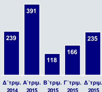
Νέα Δάνεια σε Καθυστέρηση άνω των 90 ημερών (€εκ.)

Παράλληλα, σημαντική αύξηση κατά €643εκ. κατέγραψαν οι καταθέσεις πελατών στην Ελλάδα, ενώ σε επίπεδο Ομίλου η αύξηση ανήλθε συνολικά σε €1,4δισ. σε τριμηνιαία βάση, ως αποτέλεσμα και της προσέλκυσης νέων καταθέσεων στο εξωτερικό. Η αύξηση των καταθέσεων και η διενέργεια συμφωνιών Repos στη διατραπεζική αγορά συνετέλεσαν στη μείωση της χρηματοδότησης από το ευρωσύστημα σε €24,3δισ. στο τέλος Φεβρουαρίου 2016, από €31,6δισ. στο τέλος Σεπτεμβρίου 2015.