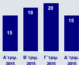
Καθαρά Επαναλαμβανόμενα Κέρδη Δραστηριοτήτων Εξωτερικού (€εκ.)

Οι δραστηριότητες στο εξωτερικό κατέγραψαν αξιοσημείωτες επιδόσεις, καθώς για πρώτη φορά μετά το 2011 επιτεύχθηκαν κέρδη σε ετήσια βάση. Ειδικότερα, τα καθαρά επαναλαμβανόμενα κέρδη διαμορφώθηκαν σε €67εκ. το 2015, έναντι ζημιών ύψους €182εκ. το 2014, με τα κέρδη το Δ' τρίμηνο να ανέρχονται σε €15εκ.