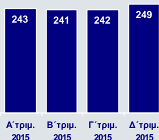
Λειτουργικά Έξοδα (€εκ.)

Τα οργανικά κέρδη προ προβλέψεων αυξήθηκαν σε €188εκ. 3 το Δ' τρίμηνο, σε σχέση με €166εκ. το Γ' τρίμηνο, ενώ τα συνολικά κέρδη προ προβλέψεων υποχώρησαν σε €181εκ. 3 , από €219εκ. το Γ' τρίμηνο, λόγω ζημιών από τα χρηματοοικονομικά έσοδα.