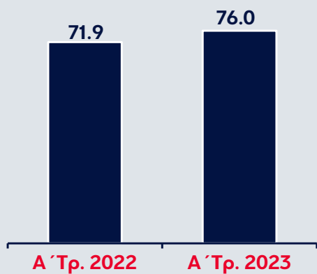
Δείκτης Κάλυψης NPEs (%)