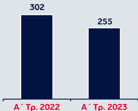
Προσαρμοσμένα Καθαρά Κέρδη (€εκ.)