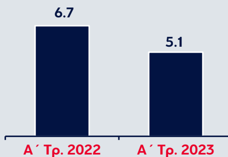
Δείκτης NPEs (%)