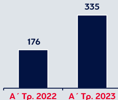
Οργανικά Λειτουργικά Κέρδη (€εκ.)